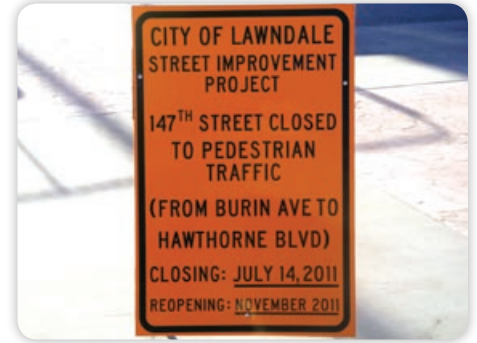
July - Street Closure - Public Notice