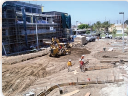
July - 147 th Street Reconstruction