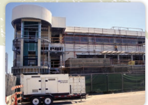
August - Facade - West View