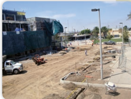
August - 147 th Street Reconstruction