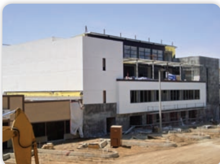
August - Exterior Plaster Finish - East View