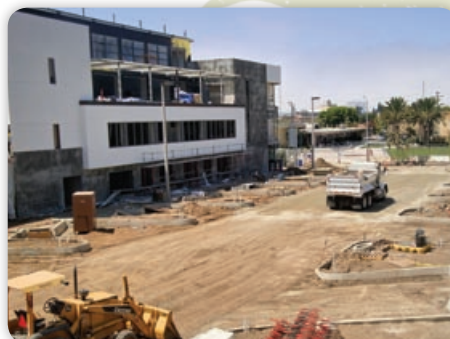
August - 147 th Street Reconstruction