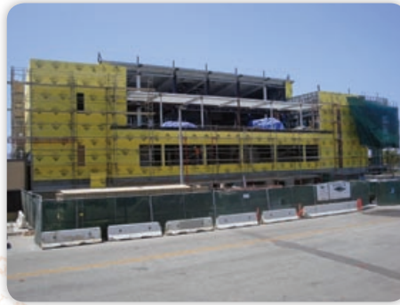
July - Exterior Sheeting - North View

Although a considerable amount of work is still being done on the exterior of the center, much of the construction has shifted to the inside of the building as the 4,000 square foot multi-purpose room, spacious aerobics room, two classrooms, 18 station computer lab, fitness room and kitchen move closer and closer towards completion. At the time of this writing, the street work on 147 th Street between Hawthorne Boulevard and Burin Avenue has begun, making way for the city's eventual Civic Center linking City Hall, the Los Angeles County Lawndale Library and the new Community Center. In the meantime, stay tuned for a Grand Opening Celebration this winter.