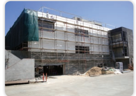
August - Exterior Plaster Finish - South View