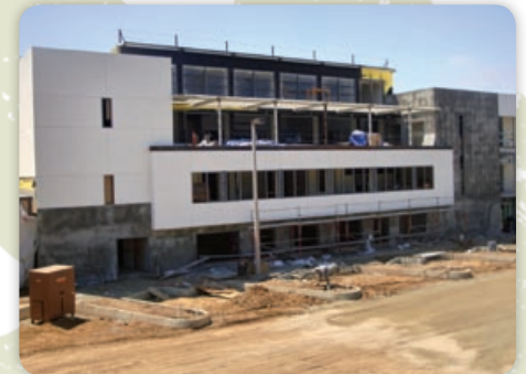
August - Exterior Plaster Finish - North View